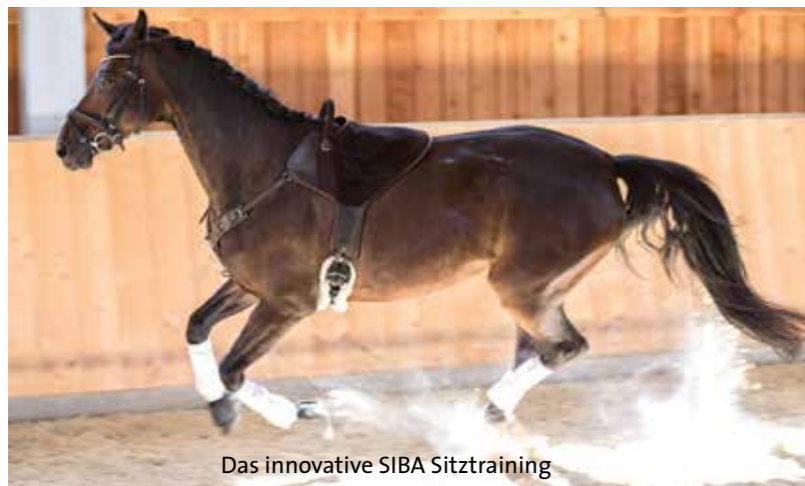
Das innovative SIBA Sitztraining

Der SIBA Sattel ist eine Kombination aus hochwertigem Leder, Filz und Balancekissen. Handgefertigt in Europa.